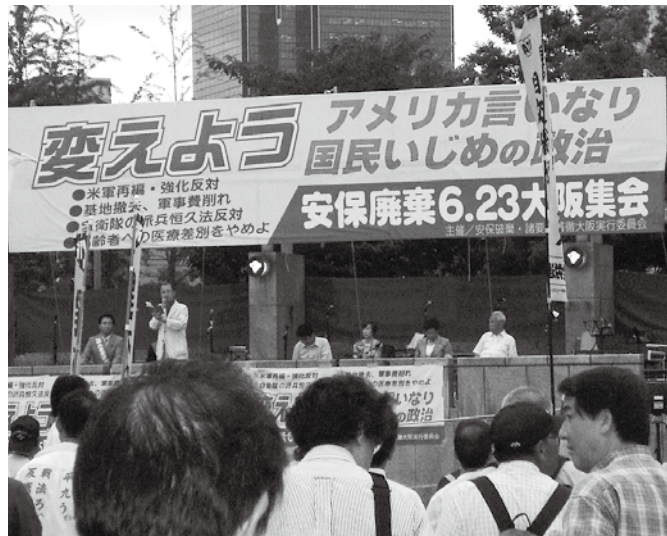
アメリカ言いなりやめよと1400人が参加(6月23日)

沖縄県民の4人に1人が福祉切捨てや医療差別の国に亡くなった沖縄戦「終結」から63年を迎えた6月23日(月)、大阪市の扇町公園で「派兵恒久法・改憲NO!」アメリカ言いなり、国民犠牲はやめよ! 安保廃棄大阪集会が開催されました。主催は安保廃棄・諸要求貫徹大阪実行委員会。1400人の府民・労働者が参加しました。「格差と貧困」の拡大、米軍基地の問題も憲法・海外派兵の問題も、その根源にあるのは安保日米同盟です。安保への疑問と関