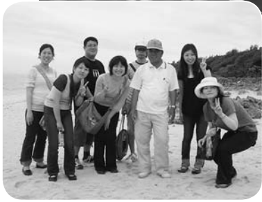
久高島で現地ガイドさんと

スでは大阪の参加者132人全員で登壇、「大阪のうまいもん」におぼちゃんの生歌の歌詞を足した「大阪名物」を会場いっぱい拍手で大合唱。オープニング企画の最後は、全員でカチャーシー(沖縄の踊り)に興じました。2次会では各自治体の労働組合の紹介をし、夜の交流も深めまし