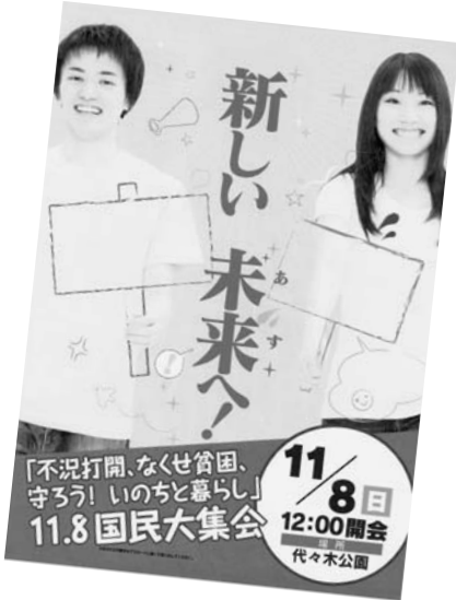
11・8国民大集会チラシ