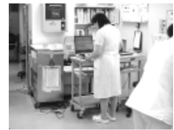
看護師が必要と言われているのは、必要人員を達成するには高校生の10人に1人が看護師にならないと計算となります。若い看護師2名の過労死を受けて、このような報告や通知が出され、改善計画が出されたことは評価できる事です。加えて、私たちは、ILO看護職員条約の批准、1回の労働時間は8時間以内、総労働労働時間の短縮、勤務間隔は12時間以上、正循環の夜勤体制、必要に応じた大幅増員を掲げ引き続き運動をすすめます。

厚生労働省は、6月17日、「看護師等の『雇用の質』の向上に関する省内プロジェクトチーム」報告書をまとめ、その報告に基づき5局長(厚生部局と労働部局の関係課)が連名通知を出しました。