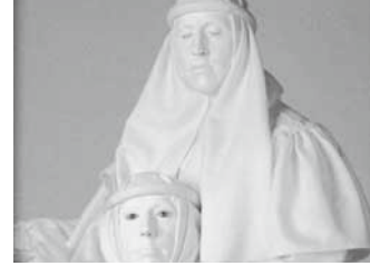
ザ・スタチューオブ ジェローム・ムラ マジック・パントマイム

一般4,700円/中学生以下3,100円のところ 特別価格 (全席指定・税込) 一般3,800円/中学生以下2,700円