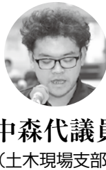
中森代議員 (土木現場支部)