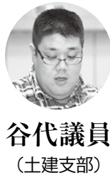
谷代議員 (土建支部)

府職労講座に若手執行委員を中心に参加して、ものごとをいろいろな角度から考え、分析し、みんなで討論、行動できる執行部づくりをめざしたいと思えます。府管住宅削減方針に対し、住民団体とともに「府管住宅削減反対連絡会」を立ち上げ、署名、宣伝、学習会を取り組んできました。「衣・食・住」の一つである「住まい」があつてこそ生活ができ、働くことができ、府民が安心して生活できる取り組みを進めます。