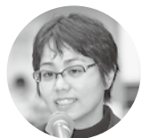
石堂代議員 (女性部)

7月より女性部常任委員として活動しています。9月に京都での「自治体働く女性」の全国交流会へ参加し、府職労70周年まつりでは、憲法の朗読を女性部で行いました。憲法朗読