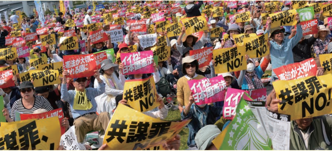
2017年「施行70年、いいネ！日本国憲法5・3集会」5万5000人参加（東京・有明防災公園）

“安倍9条改憲”反対の一点で手をつなぎましょう。3000万人の「戦争はイヤだ」の声を集めて、9条を未来につないでいきましょう。